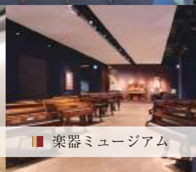
■ 楽器ミュージアム