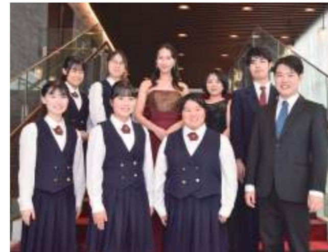
ブラームスホールホワイエ(江古田キャンパス)