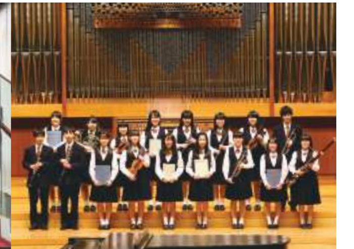
パッサゲールステージ(入間キャンパス)