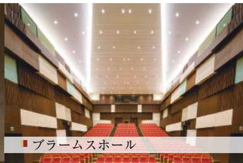
■ ブラームスホール