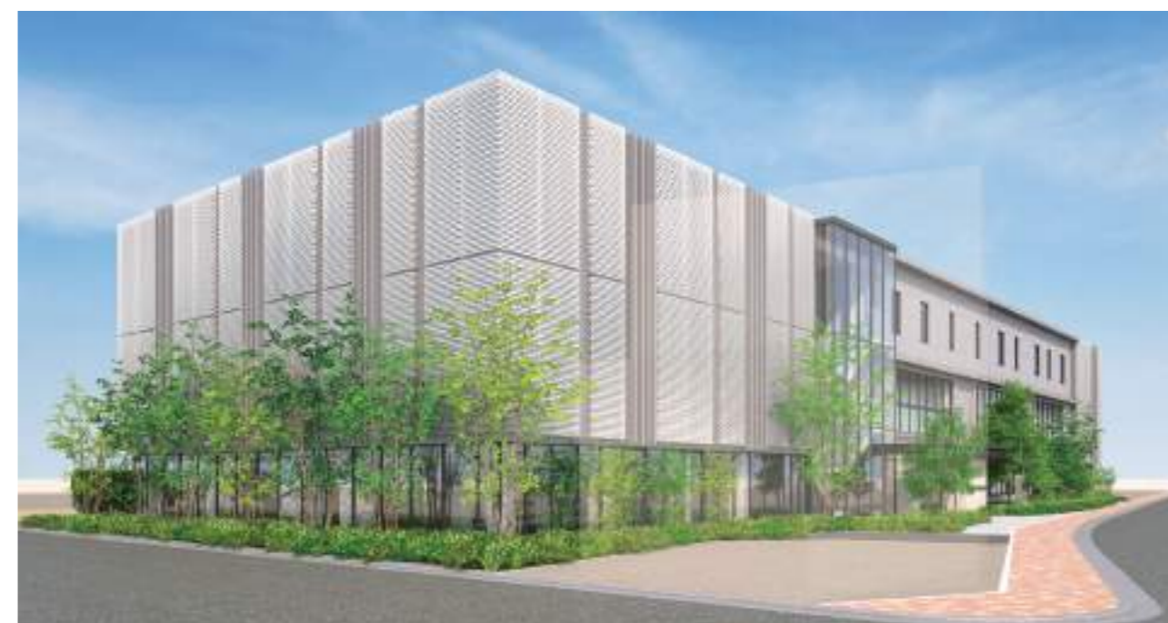
※計画パースイメージは2024年3月現在のものであり、今後変更となる可能性があります。

新しい音楽教育の在り方を体現する高校に相応しく、あたかも“街角に浮遊する塊”のような、未来を感じさせる外観デザインの 新校舎は、 きっとそこに集う生徒たちによって更なる輝きを増していく と思います。音楽を学ぶことに最適な環境で、希望に胸を膨らませている元気な笑顔と出会うことを、私たちは楽しみにしています。