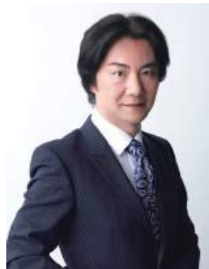
武蔵野音楽大学 学長 武蔵野音楽大学附属高等学校 校長