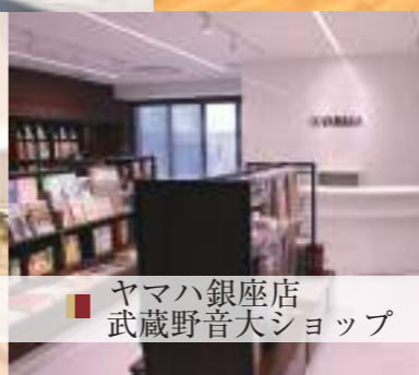
■ ヤマハ銀座店 武蔵野音大ショップ