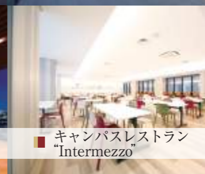
■ キャンパスレストラン 「Intermezzo」