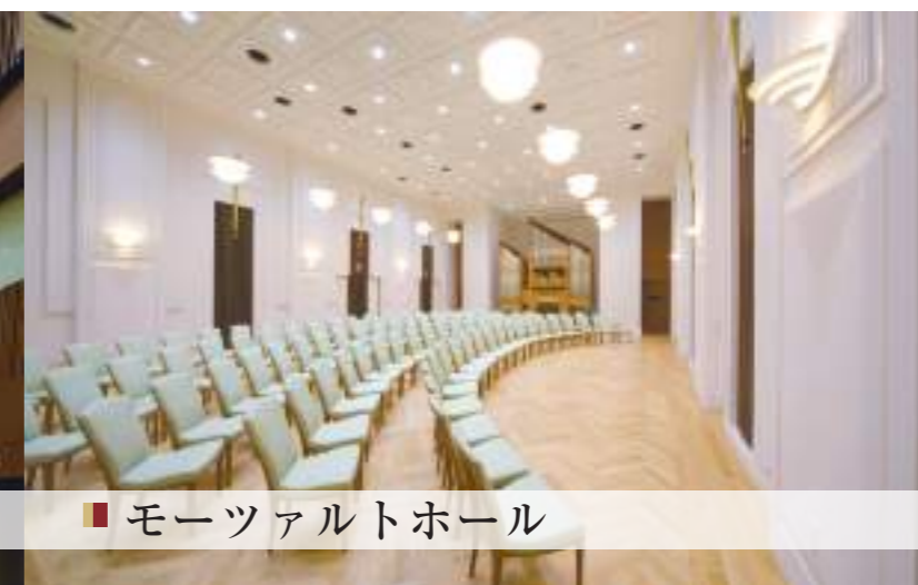
■ モーツァルトホール