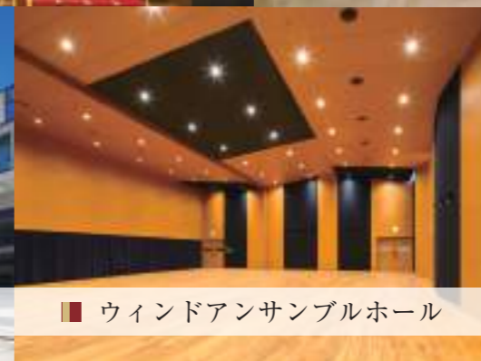
■ ウィンドアンサンブルホール