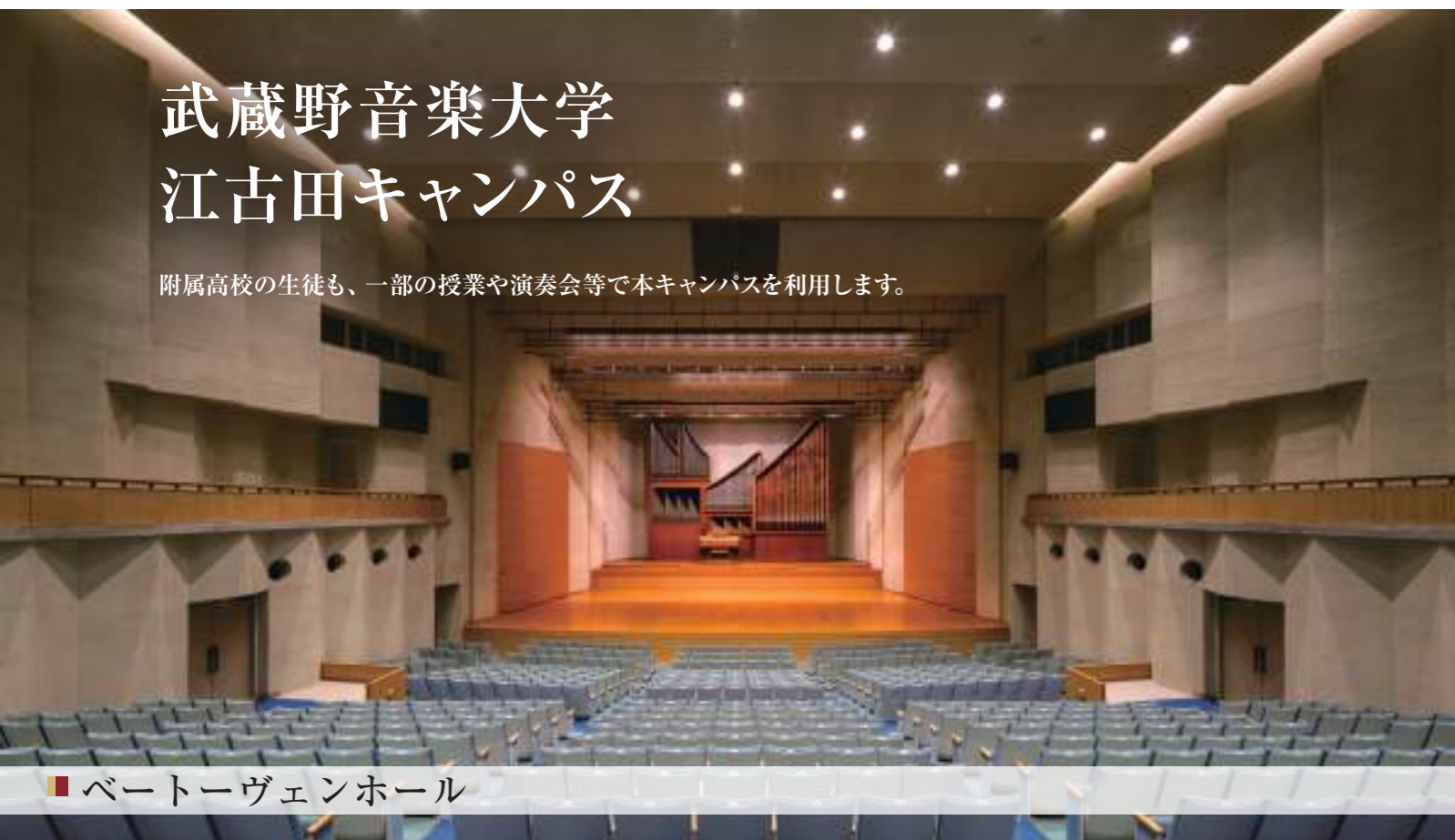
■ ベートーヴェンホール