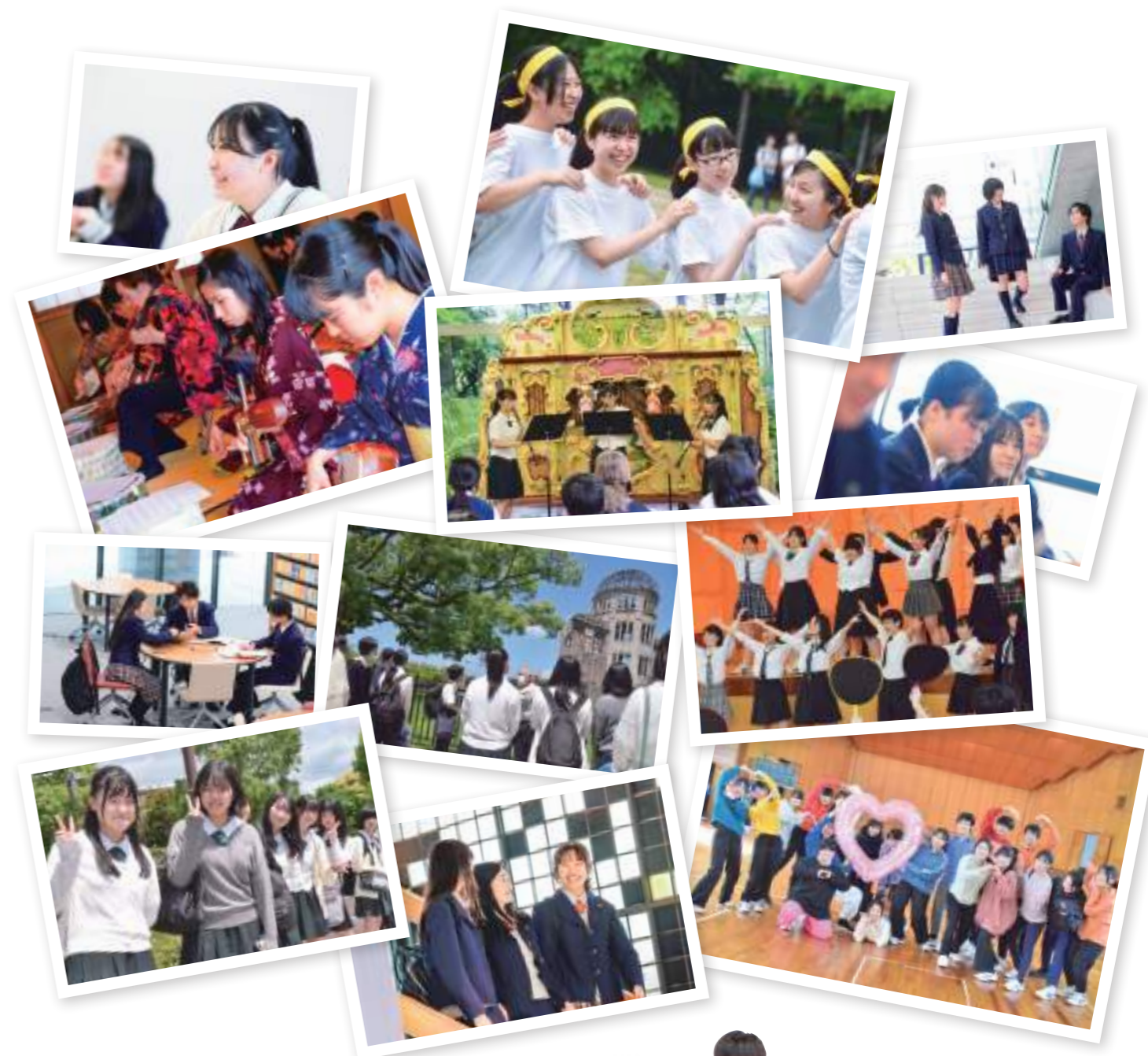
坂東玉三郎特別招聘教授 （特別講座）