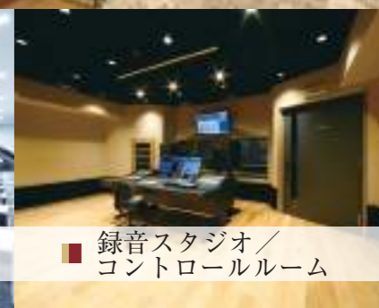
■ 録音スタジオ/ コントロールルーム